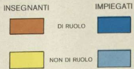
PERSONALE VINCOLATO DALLA SCUOLA PER TIPO DI ISTRUZIONE