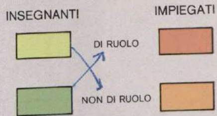
PERSONALE VINCOLATO DELLA SCUOLA PER TIPO DI ISTRUZIONE