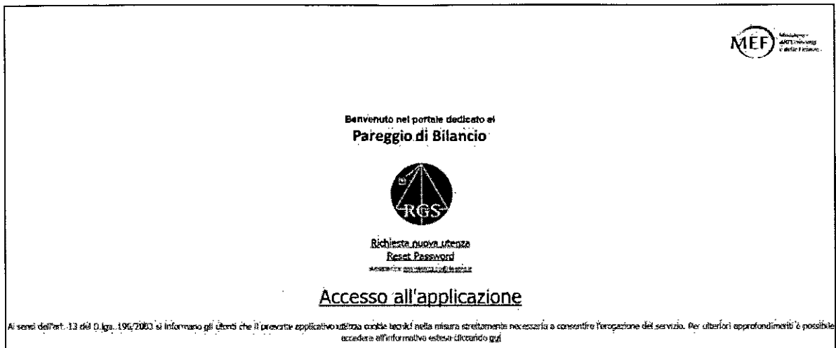
Figura 1: pagina iniziale

È necessario compilare il modulo di richiesta (figura 2).