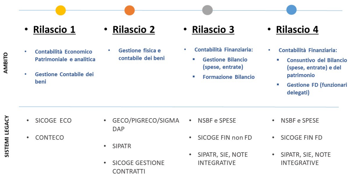
Figura 1 – Progressivi rilasci previsti nell’ambito del programma InIt

Ogni rilascio è focalizzato su uno o più ambiti contabili e impatta sulle funzionalità degli attuali sistemi resi disponibili dalla RGS (detti sistemi legacy) che verranno progressivamente assorbiti dal nuovo sistema InIt. Il graduale assorbimento o integrazione in InIt potrà riguardare anche altri sistemi legacy gestiti dalle singole amministrazioni interessate.